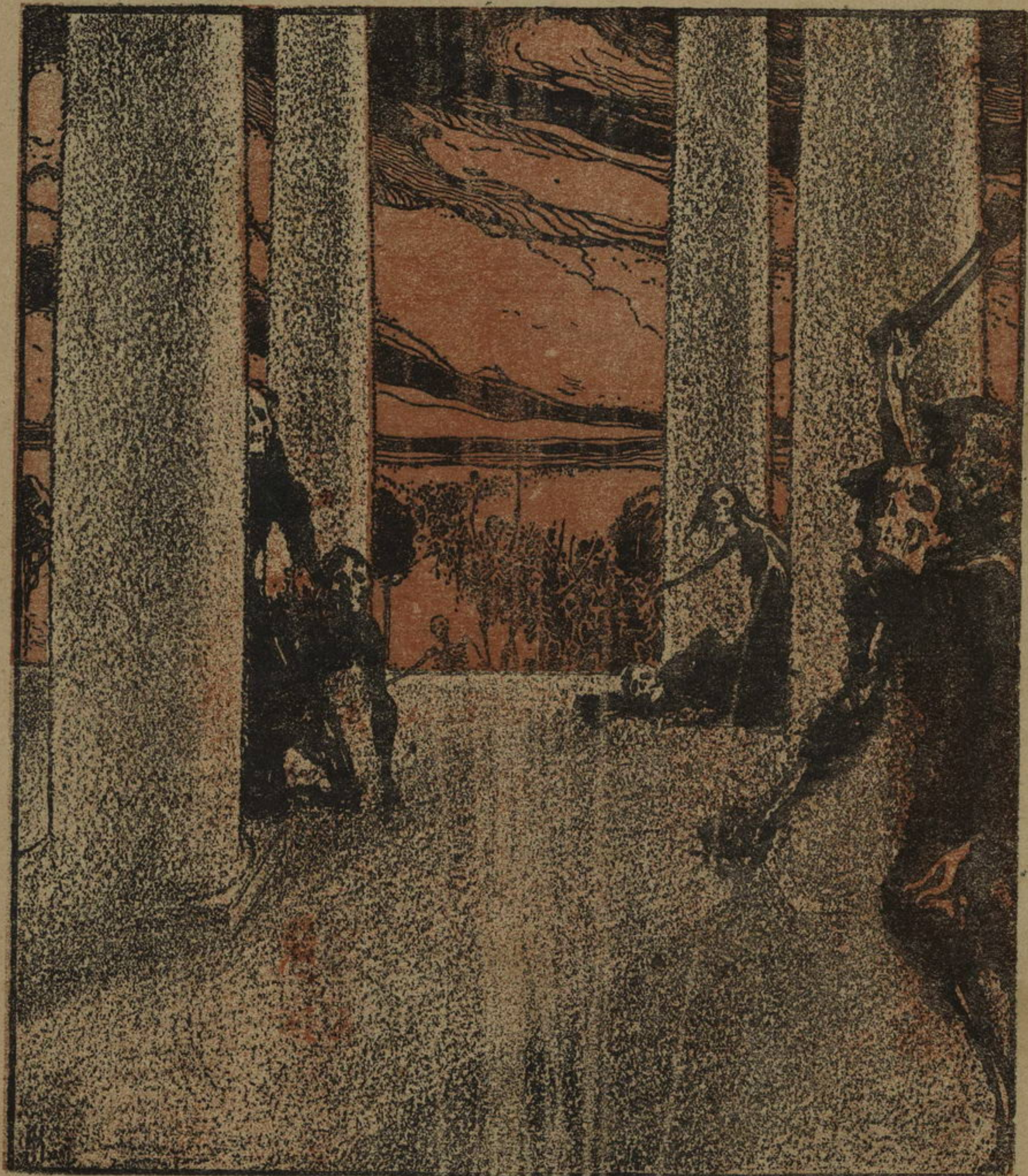
Голодъ идетъ ко двору.