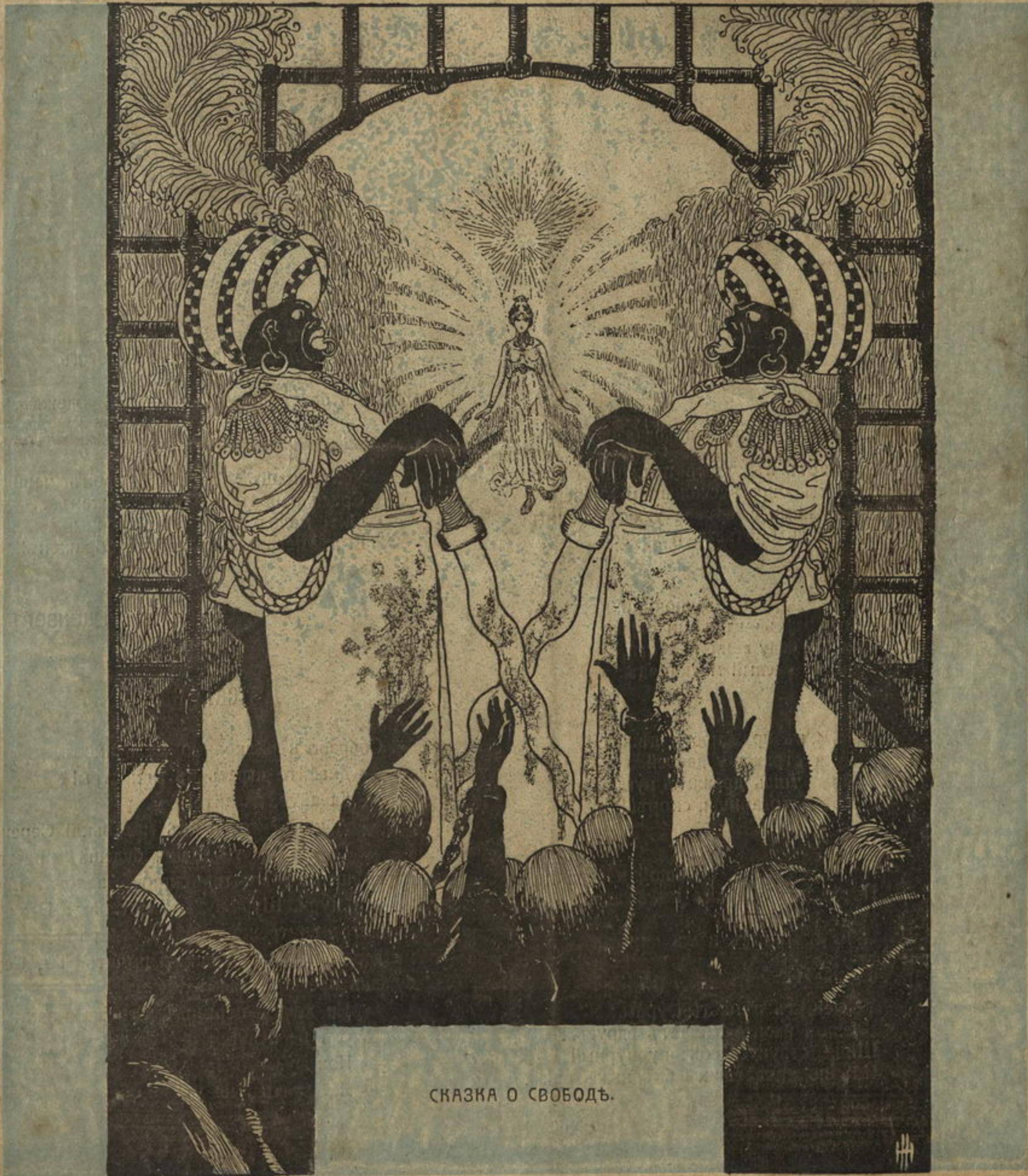
СКАЗКА О СВОБОДѢ.