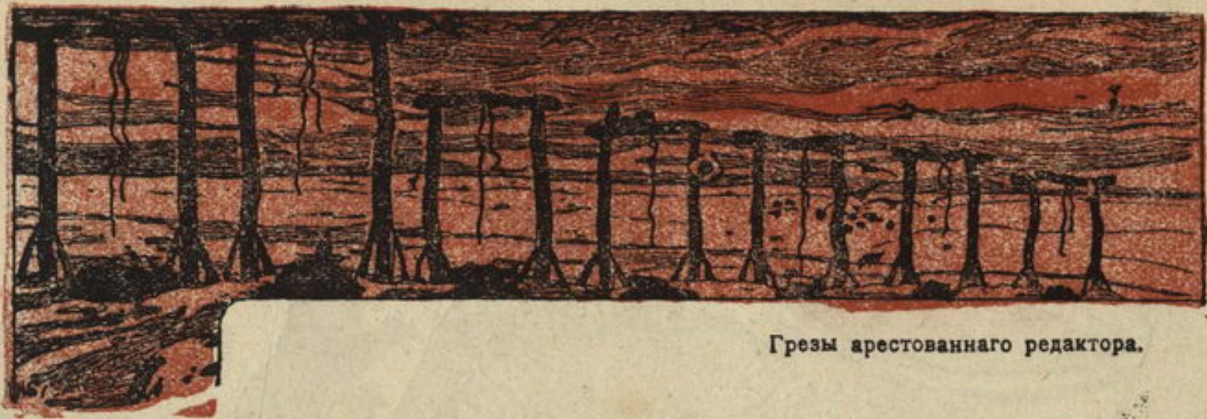
Грезы арестованнаго редактора.