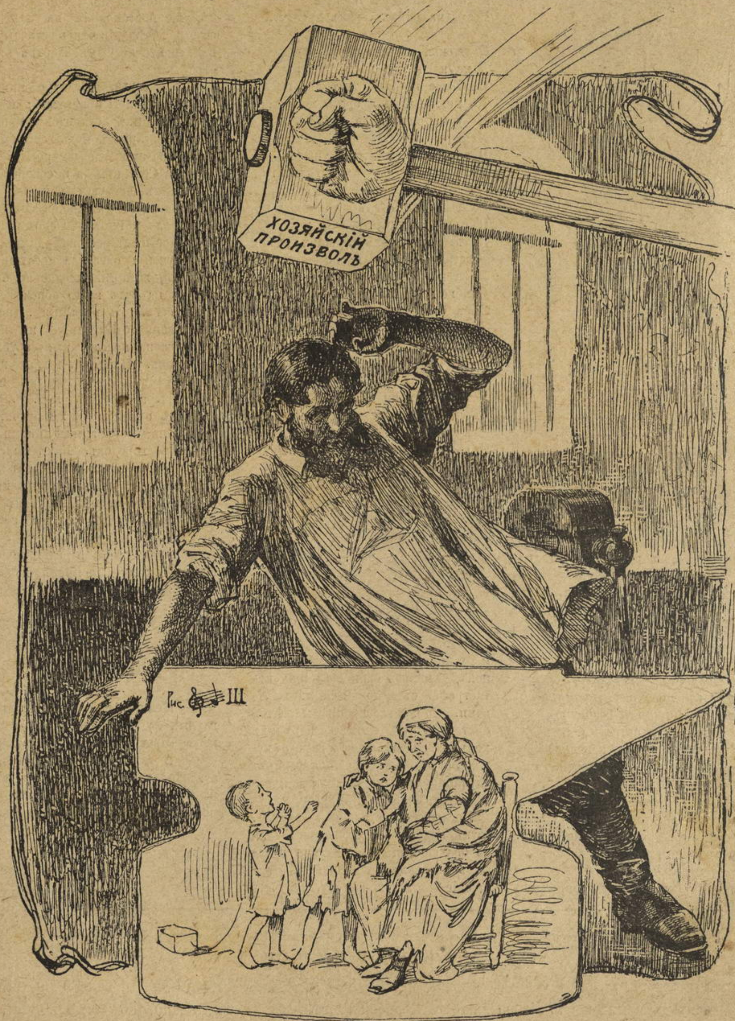
Рис. Ш III